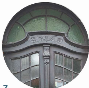
7 Cieplicka stolarka držíová truhlářské prvky dveří

Na dřevěných oknech a dveřích jsou často umístěny ozdobné prvky, které dotvářejí charakter a styl celé budovy. Mohou to být rozety a ornamenty, členění oken vnějšky přičlemy a ozdobnými sloupky, vitráže, konzoly, profilované listvy, vyřezávané postavy, květinové a figurální motyvy.