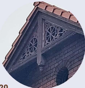
20 Fabryczna střešní okapová část střechy okapová část střechy