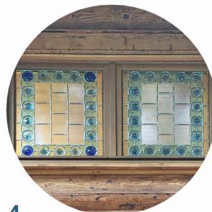
4 Park Norweski stolarka okiená truhlářské prvky oken