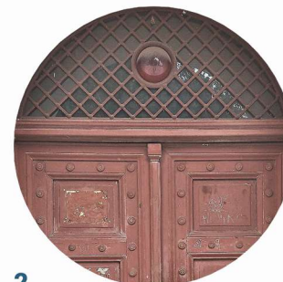
2 Plac Piastowski stolarka držíová truhlářské prvky dveří