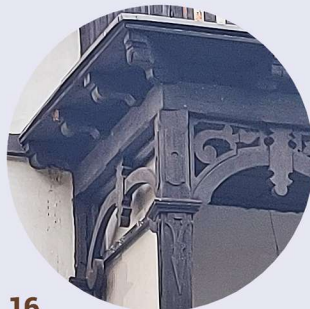
16 Mieszka I veranda veranda