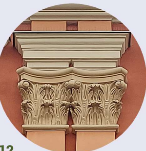
12 Piotra Ściegiennego pilastry pilastry