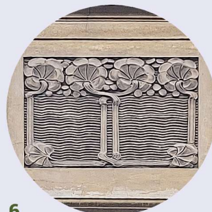
6 Wojciecha Tabaki artykulace stěn členění zdí