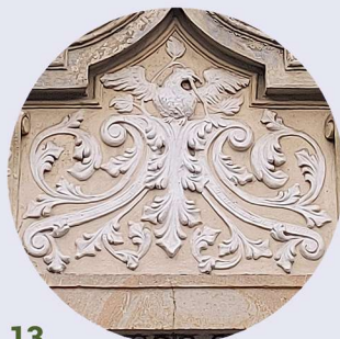
13 Jagiellońska naczolky okienne suprafenestra