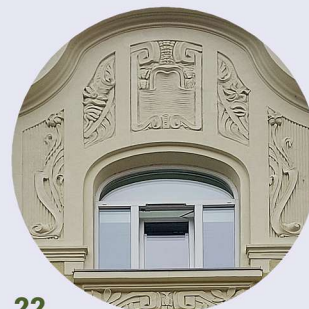
22 Staromiejska artykulace stěn členění zdí