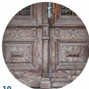
10 Cieplicka stolarka držíová truhlářské prvky dveří