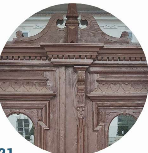
21 Plac Piastowski stolarka držíová truhlářské prvky dveří