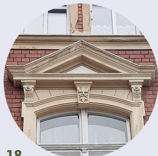
18 Plac Piastowski naczolky i opasky okienne fronton a okenní sambrány

Sztuková výzdoba byla známá již v antice, a velmi populární se stala zejména v období renesance a baroka. Obvykle je tvořena z omítkové hmoty, často se odlévá po částech pomocí šablony a připevňuje se k podkladu, mnohdy s kovovou nebo dřevěnou výztuhou. Může mít podobu říms, suprafenestry, hlavice, rozet, sambrán, pilastrů, konzol, členění zdí atd.