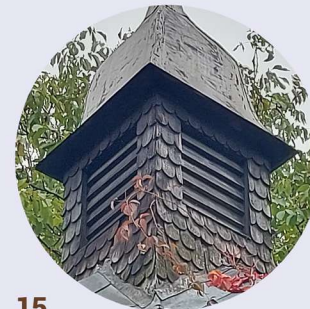
15 Św. Jadwigi Śląskiej zvrchol dachu vrchol střechy