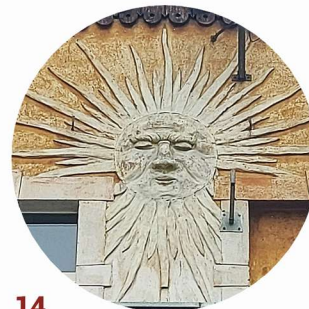
14 Św. Jadwigi Śląskiej artykulace stěn členění zdí