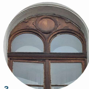
3 Park Zdrojowy stolarka okiená truhlářské prvky oken