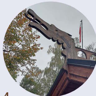
4 Park Norweski zvrchol dachu vrchol střechy