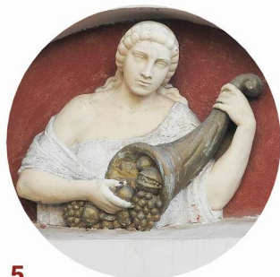
5 Wojciecha Tabaki portal wejściowy vstupní portál

Sochařská výzdoba je v architektuře důležitým prvkem, který jí dodává estetickou hodnotu a často i symbolický nebo kulturní význam. Je zhotovena z trvanlivých materiálů, jako jsou různé druhy kamene, terakota či kov, což jí zajišťuje dlouhou životnost a odolnost vůči povětrnostním vlivům. Sochařské prvky mohou být umístěny například na frontony, portály, atiky, sloupce, vlysy či kolem okenních otvorů.