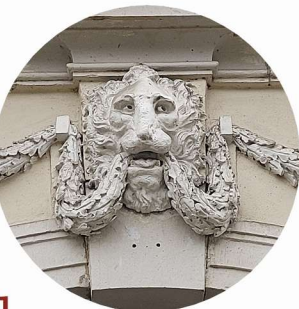
1 Plac Piastowski portal wejściowy vstupní portál