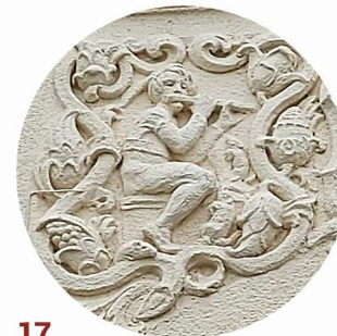
17 Gimnazjalna artykulace stěn artykulace stěn