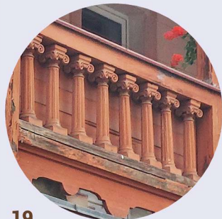
19 Plac Piastowski veranda veranda

Tesařské prvky mají často historický, kulturní nebo symbolický význam, čímž přispívají ke zvláštnosti stylu, charakteru a jedinečnosti budovy. Může jít mimo jiné o řezbářsky zpracované konstrukční prvky zdí a střech, verandy, římsy, balustrády, zábradlí, vlysy, obložení zdí, sambrány, sloupce či detaily okapových částí střech.