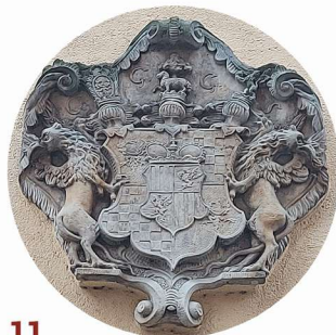
11 Piotra Ściegiennego artykulace stěn členění zdí