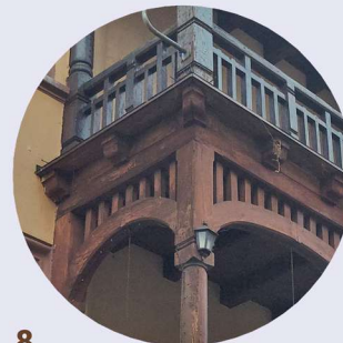
8 Cieplicka veranda veranda