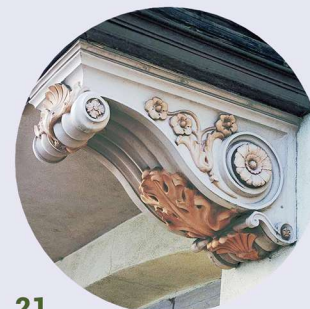
21 Plac Piastowski wspornik wykusza nosník arkýre