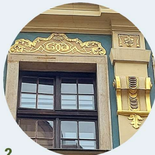
2 Krótka pilastry i obramienia okienne pilastry a okenní šambrány