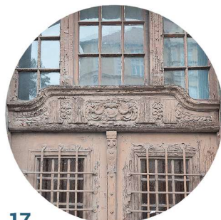
17 Pocztowa stolarka drzwiowa truhlářské prvky dveří

Na dřevěných oknech a dveřích jsou často umístěny ozdobné prvky, které dotvářejí charakter a styl celé budovy. Mohou to být rozety a ornamenty, členění oken vnějšími příčlemi a ozdobnými sloupky, vitráže, konzoly, profilované listvy, vyřezávané postavy, květinové a figurální motivy.