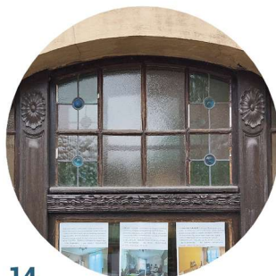
14 1 Maja stolarka okienna truhlářské prvky oken