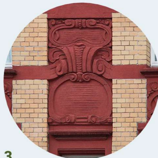
3 Długa artykulacja ścian členění zdi