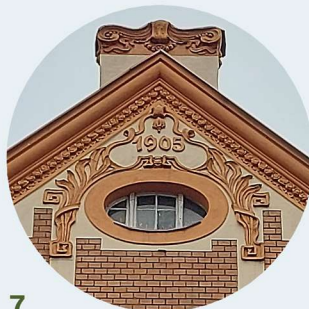
7 Matejki strefa okapova dachu okapová část střechy