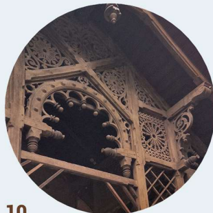
10 Armii Krajowej zadaszenie wejścia do budynku zastřešení vchodu do budovy