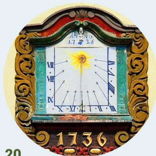
20 1 Maja obramienia okienne okenní šambrány