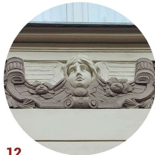
12 Aleja Wojska Polskiego pas podokienny podokenní pás

Sochařská výzdoba je v architektuře důležitým prvkem, který jí dodává estetickou hodnotu a často i symbolický nebo kulturní výraz. Je zhotovena z trvanlivých materiálů, jako jsou různé druhy kamene, terrakota či kov, což jí zajišťuje dlouhou životnost a odolnost vůči povětrnostním vlivům. Sochařské prvky mohou být umístěny například na frontony, portály, atiky, sloupky, vlysy či kolem okenních otvorů.