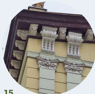
15 1 Maja pilastry i gzyms okapowy pilastry a okapová římsa

Štuková výzdoba byla známá již v antice, a velmi populární se stala zejména v období renesance a baroka. Obvykle je tvořena z omítkové hmoty, často se odlévá po částech pomocí šablon a připevňuje se k podkladu, mnohdy s kovovou nebo dřevěnou výztuhou. Může mít podobu říms, suprafenestr, hlavic, rozet, pilastrů, konzolí, členění zdi atd.