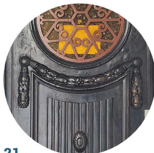
21 Plac Ratuszowy stolarka drzwiowa truhlářské prvky dveří