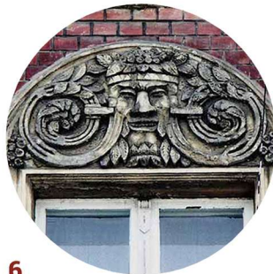
6 Matejki naczótek okienny suprafenestra