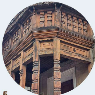
5 Matejki weranda veranda