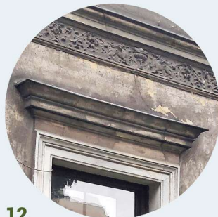
12 Armii Krajowej gzyms i obramienia okienne římsa a orámování okna