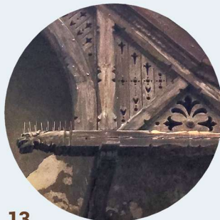
13 Aleja Wojska Polskiego strefa okapova dachu okapová část střechy