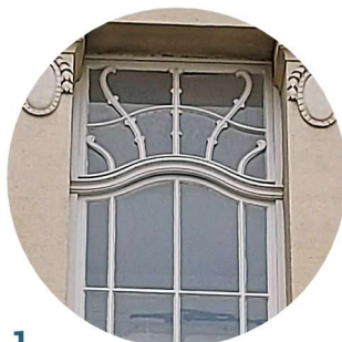
1 Plac Ratuszowy stolarka okienna truhlářské prvky oken