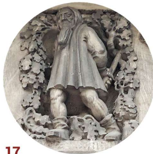
17 Pocztowa portal wejściowy vstupní portál