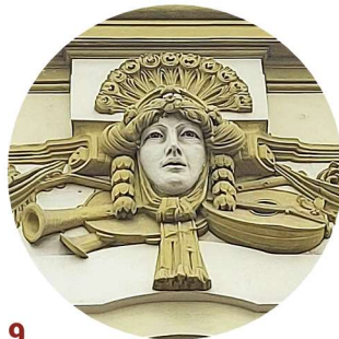
9 Aleja Wojska Polskiego gzyms koronujący korunní římsa