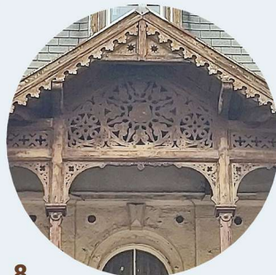
8 Aleja Wojska Polskiego strefa okapova dachu verandy okapová část střechy verandy

Tesárske prvky majú často historický, kultúrny alebo symbolický význam, čím prispievajú k zdôrazneniu štýlu, charakteru a jedinečnosti budovy. Môže íť mimo iné o rezbárske spracované konštrukčné prvky zdi a strech, verandy, římsy, balustrády, zábradlí, vlysy, obložení zdi, sambrány, sloupky či detaily okapových častí střech.