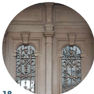
18 1 Maja stolarka drzwiowa truhlářské prvky dveří