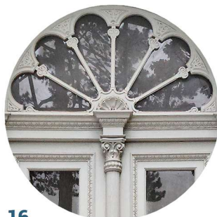
16 Kilińskiego stolarka drzwiowa truhlářské prvky dveří