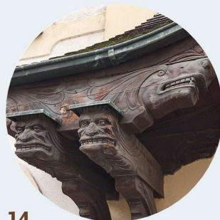
14 1 Maja zadaszenie wejścia do budynku zastřešení vchodu do budovy