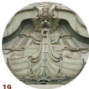
19 1 Maja portal wejściowy vstupní portál