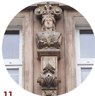
11 Aleja Wojska Polskiego pilastry pilastry